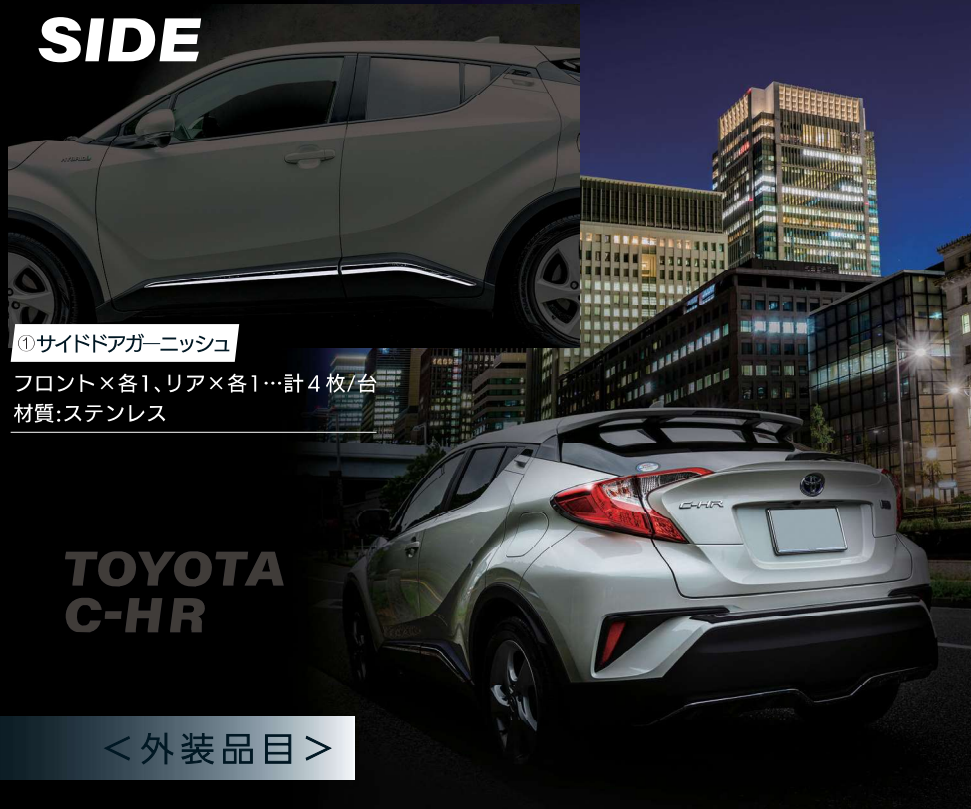
① サイドドアガーニッシュ