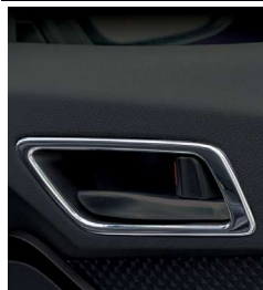
インナードアベゼル