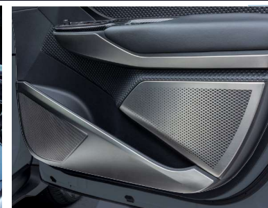
⑧ メタルパネル フロント×各3 リア×各1 計8枚/台 材質:ステンレス