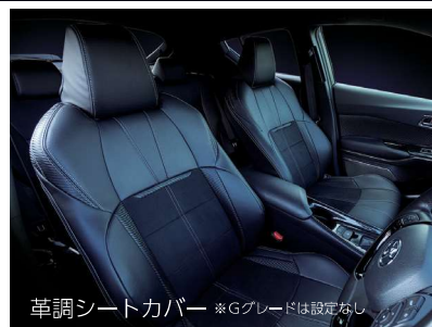
革調シートカバー *Gグレードは設定なし