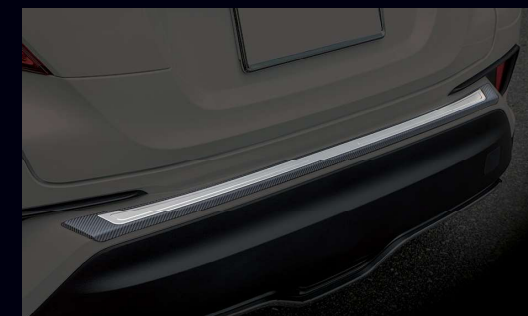
⑤ リアバンパーステップガード 材質:樹脂(カーボン調)+ステンレス