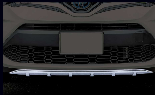
② フロントアンダーカバー 材質:樹脂(メッキ)